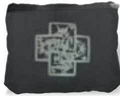
タタンダポストン 150×200×35