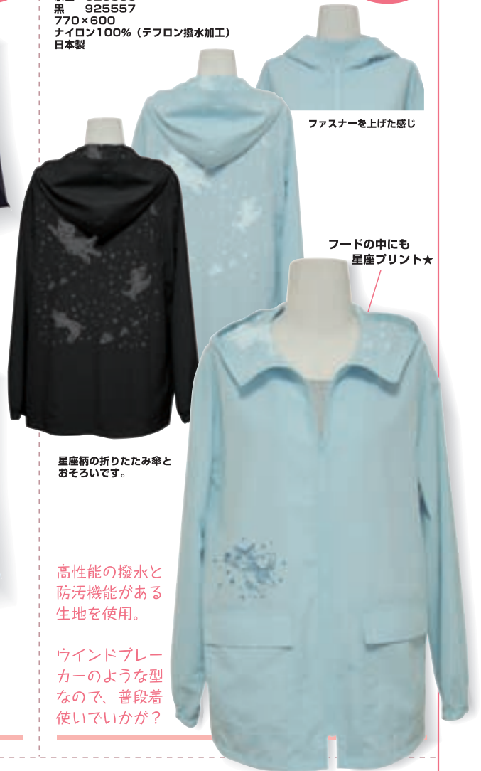
ファスナーを上げた感じ