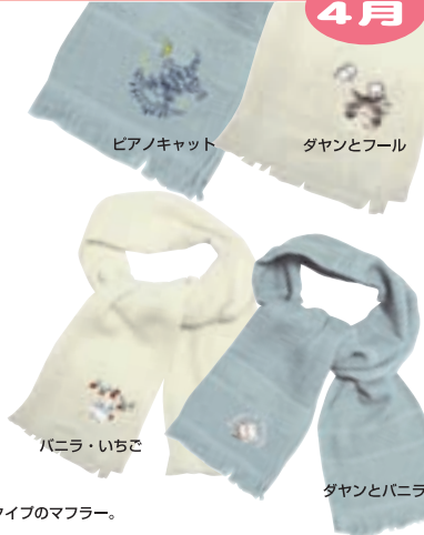
ピアノキャット ダヤンとフル

首元を紫外線や汗から守るおしゃれなガーゼタイプのマフラー。 プレゼントにもとっても喜ばれるよ！