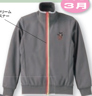
ピンク×クリーム 上下ファスナー

サラッとしたドライ素材で 春夏に向けてスポーツに 適したジャージ。ファスナーは Wスライダーで2カラーの アシンメトリーがポイントです。