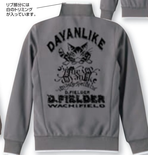
リブ部分には 白のトリミング が入っています。

サラッとしたドライ素材で 春夏に向けてスポーツに 適したジャージ。ファスナーは Wスライダーで2カラーの アシンメトリーがポイントです。