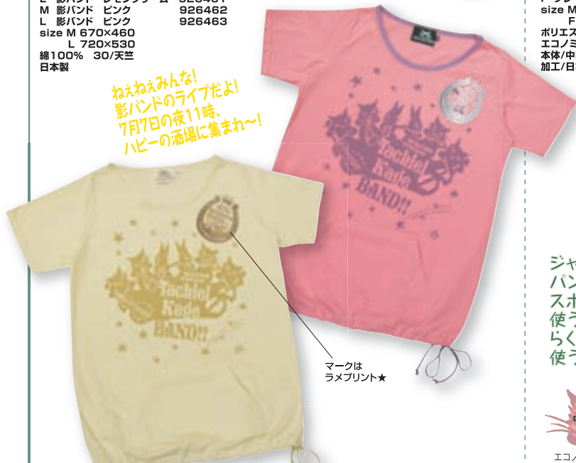
マークは ラメプリント★

ねえねえみんな! 影バンドのライブだよ! 7月7日の夜11時、 ハビの酒場に集まれ〜!