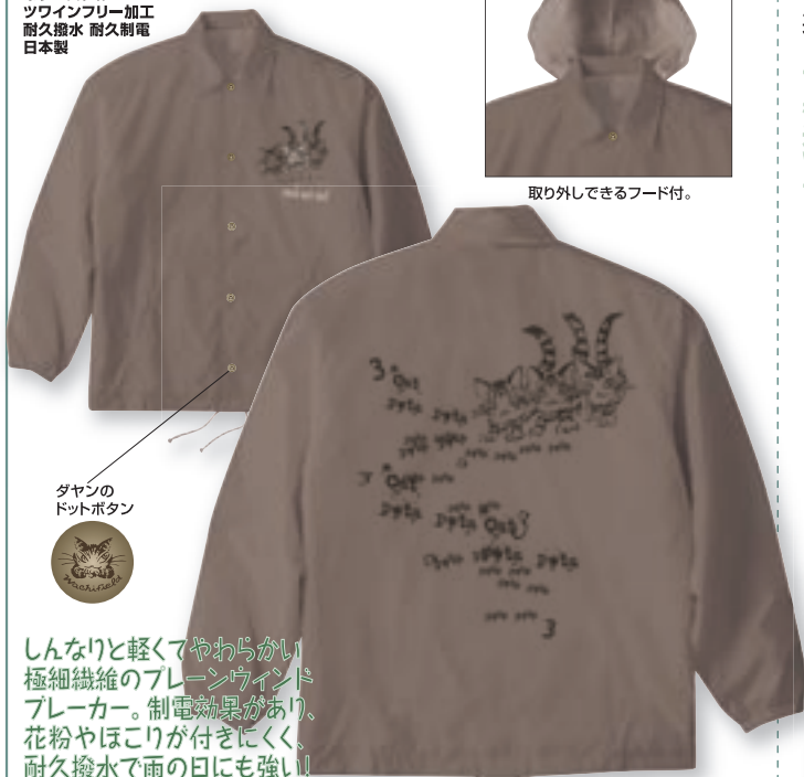
ダヤンの ドットボタン