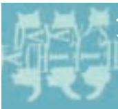
ワンポイントのバックプリントあり