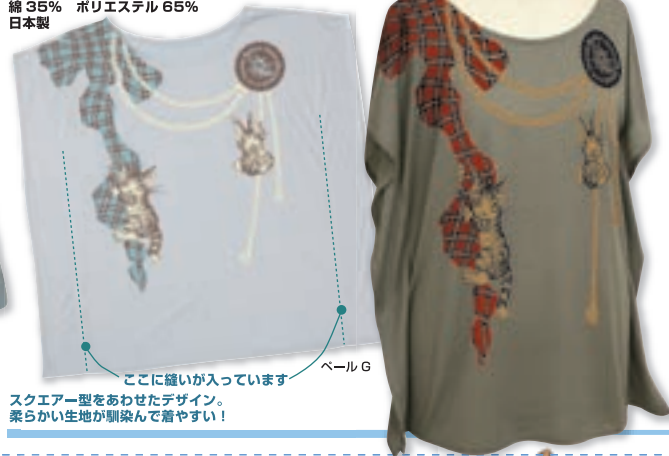
ここに縫いが入っています