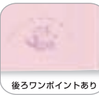
後ろワンポイントあり

綿 50% ポリエステル 50% エコノミカルドライ 本体中国製 / 加工日本製