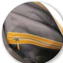
内側ファスナーポケット