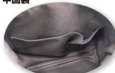
内側オープンポケット