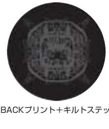
BACKプリント+キルトステッチ