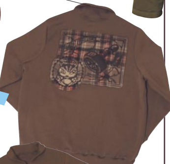
BACK柄 チェックアップリケ + 刺繍