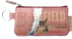
ストロベリー・ピンク