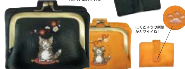
にくきゅうの刺繍 がカワイイね！

がま小銭の中にダヤンコイン一枚入り！！銭亀ならぬ銭ダヤン。黒も黄色も 金運を高める色と言われています☆人気の地図柄がま口バースと同型です。