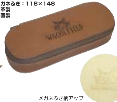
メガネふき柄アップ

人気のメガネケース型にDBも仲間入り。安心の芯地入りで大事なメガネをしっかりと守ってくれます。メガネふき付です。