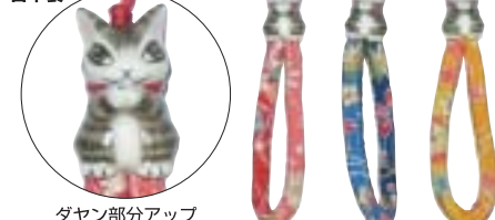
ダヤン部分アップ

赤 922610 青 922611 黄 922612 ダヤン部分のみ25×15×17 ダヤン+ちりめん紐100×15×17 ダヤン部分：陶器製 生地部分：レーヨン100% 日本製