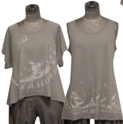
きれいなシルエットのAライン

ミジカちゃんとナガちゃん 揃って大の仲良しだけど、 それぞれに大活躍できる! ばらばらになったって へこたれないんだよ(笑)