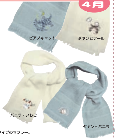
ピアノキャット ダヤンとフル

首元を紫外線や汗から守るおしゃれなガーゼタイプのマフラー。 プレゼントにもとっても喜ばれるよ！