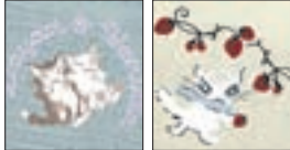
ダヤンとパニラ パニラ・いちご

首元を紫外線や汗から守るおしゃれなガーゼタイプのマフラー。 プレゼントにもとっても喜ばれるよ！