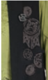
プリント + ボタン