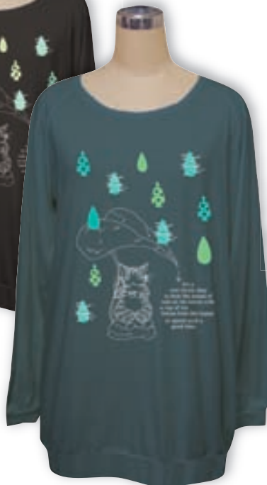
ピッチョン! ミッドターコ