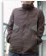
Fの部分配色はカーキグリーン系