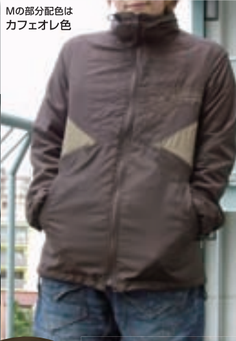
Mの部分配色はカフエオレ色