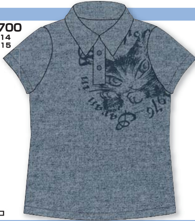
ドライで速乾なデニムライクなポロ