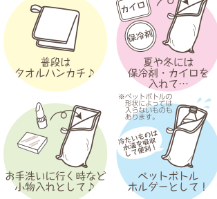
普段は タオルハンカチ♪