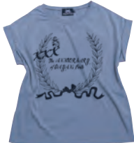
ヘクター ブルー フロントプリント柄

いよいよ30thも たけなわだね! うっかり買い遅れた人 いませんか? まだまだほしい、 まだ間に合いますよ!