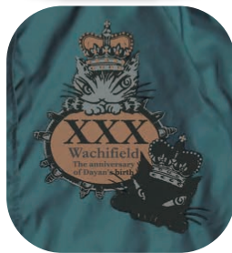
胸部プリント柄アップ

秋になってもしばらく活躍する3シーズンウインドブルゾン。突然の豪雨のためにカバンに入れてきたい。くるとまとめればポケットアップにもなる。