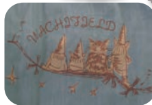
フロントプリント柄アップ

とにかくナチュラルな着心地のいい日本製のカバーオールシャツ。ふんわりとした雰囲気も甘さも控えて優しい。ざつと羽織れるカバーシャツ。