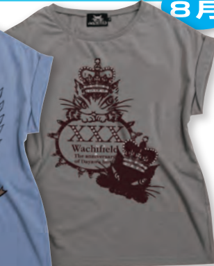
30th チャコールグレイ フロントプリント柄 30thのフロント柄は宝石のように ラメプリントがちりばめられています。