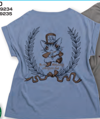
ヘクター ブルー バックプリント柄