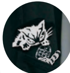
ダヤン部分はガンメタキララメプリント