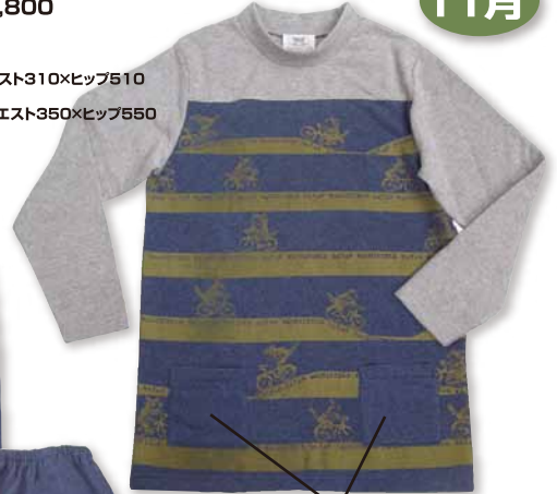
上着はポケット付き