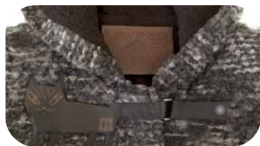
猫型革ラベルアップ

猫みみ付きフード。ブランドネームは革ラベル。 しっぽの先をDカンに通してドットボタンで留めます。