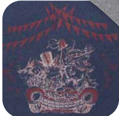
ブルーモク バックプリント