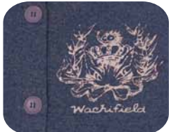
ブルーモク フロント

30thのアニバーサリーの柄のバックプリントが にぎやかに入ったカーデタイプ。 フロントがボタンタイプのところも ちょっとノスタルジックでかわいいんです。