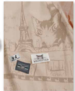
パリのごねこのプリント柄にオリネームをベタベタ♪

毎年人気の型なんだけど、今年は薄い色で春夏にぴったり。ブルー系はエアリーなさわやかさ。ピンクはくったり柔らかな女の子系。異なる素材感でどっちもいいね♪袖はストリングで調節できて、タンクトップなどにはおるのにぴったりのオーバーサイズ。