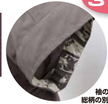
袖の内側には総柄の別生地が♪