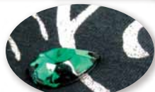
キラリ涙はトランスファーが付いている。

のびーる、ストレッチなペア天竺。でも、僕はあんまりのびさないでね、だって、泣いちゃうよ、、、