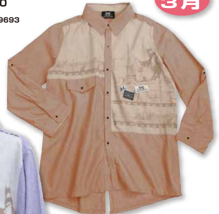
アンティークピンク系