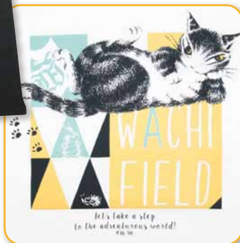
前プリントアップ

綿素材のボディ色は ベーシック色ですが、 プリント色でちょい派手な 色味を使っています。 ちょっと馴染んだ色味に あきたら、こちらをどうぞ!