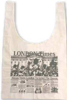
ロンドンタイムス

畳むと軽くてコンパクト。 大きな簡易バッグです。 リュックの様に背負ったり取っ手を結んで ショルダーにしたり。 ペーパーカーにそのまま掛けてママバッグと しても♪